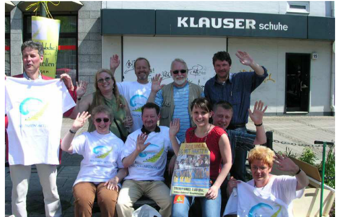
SOLINGEN AKTIV bei der 1.Mai-Veranstaltung des DGB 2007.

Wir treten ein für den Erhalt wohnortnaher preiswerter Schwimmbäder und wenden uns entschieden gegen das Kombibad. Wir fördern den Zusammenschluss betroffener Bürger gegen diese Pläne.