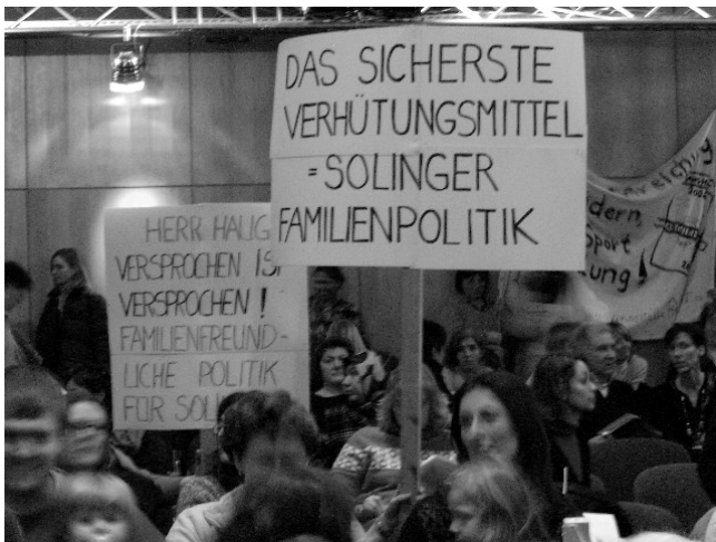
Proteste bei der Verabschiedung des Haushalts 2006/2007

Grundlinie: die große Masse der Menschen wird immer ärmer, einige wenige immer reicher und die steigenden Kosten zur Verwaltung von Armut und Arbeitslosigkeit werden der Kommune aufgebürdet. Da braucht sich keiner zu wundern, wenn die herrschende Politik zunehmend grundsätzlich in Misskredit gerät!